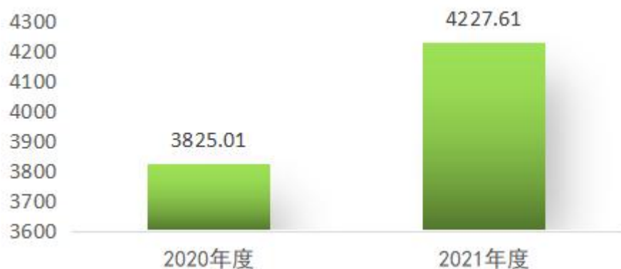
图 4：财政拨款收、支决算总计变动情况（单位：万元）

2021 年度财政拨款收、支总计 4,277.61 万元。与 2020 年度相比，财政拨款收、支总计各增加 402.6 万元，增长 10.5%。主要原因是增加一次性项目 1 号培训楼维修改造项目资金 610.2 万元。