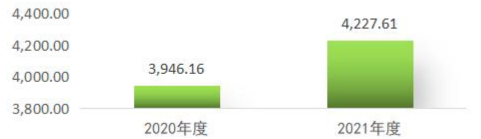
图 1：收、支决算总计变动情况（单位：万元）

2021 年度收、支总计 4,277.61 万元。与 2020 年度相比，收、支总计各增加 329.45 万元，增长 8.3%，主要原因是增加一次性项目 1 号培训楼维修改造项目资金 610.2 万元。